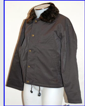
Navy Patrol Jacket Made in USA